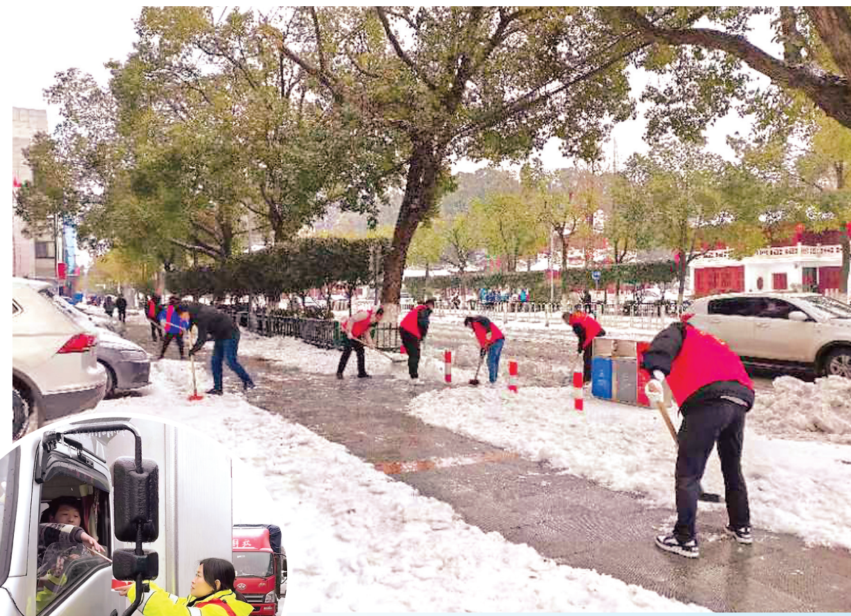
▲铲冰除雪保城市道路畅通。

虽然天寒地冻,但人心火热,暖心的一幕幕在岳阳频频上演,更是让出门在外的人们倍感温暖。3路和56路公交车冰雪中“趴窝”,志愿者和路人秒变“推车侠”;私家车打滑,消防救援人员和交警躬身相助。百余车辆滞留高